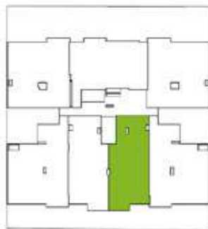
Calle Baca Flor 330