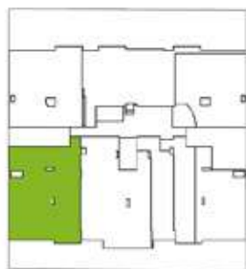
Calle Baca Flor 330